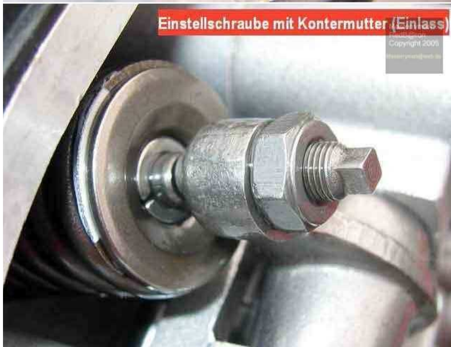
Einstellschraube mit Kontermutter (Einlass)