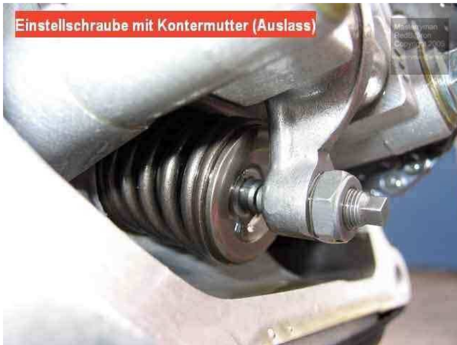
Einstellschraube mit Kontermutter (Auslass)